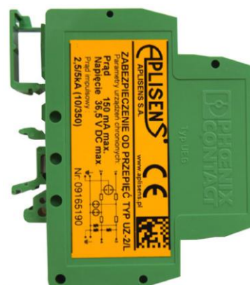
Вариант на рейке TS-35 и TS-32