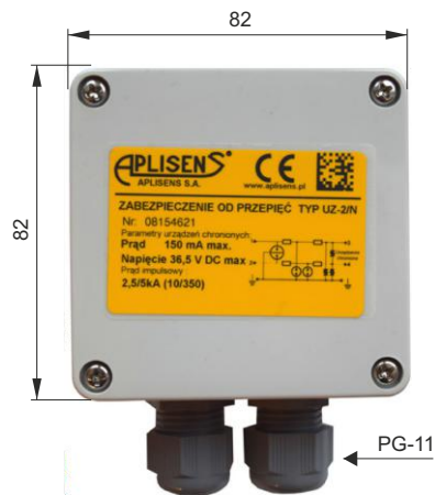
Вариант настенный IP65 Толщина коробки 55 мм