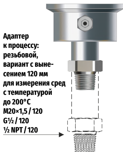
Адаптер к процессу: резьбовой, вариант с вынесением 120 мм для измерения сред с температурой до 200°C M20×1,5 / 120 G1/2 / 120 1/2 NPT / 120