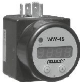
Индикатор PMS-11K (WW-45)