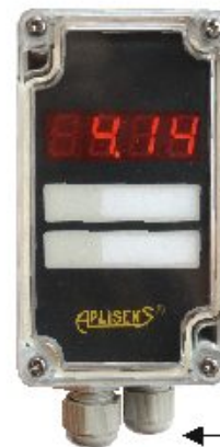
Каб. ввод PG-9

Индикатор PMS-11K предназначен для совместной работы с любым устройством, имеющим выходной сигнал (4 ± 20) мА и оснащенный на выходе стандартным штепсельным разъемом типа DIN 43 650. Основным применением указателя является совмещение местного контроля с дистанционным контролем измерения давления или разности давлений. Индикаторы PMS-11K имеют возможность конфигурации диапазона показаний от -999 до 9999 и позицию десятичной точки. Оснащены дисплеем LED (красным) с высотой цифр 7,62 мм, а также программируемым дискретным выходом типа открытый коллектор (OC). Индикатор не требует дополнительного питания.