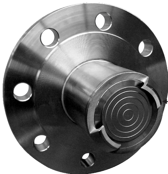
Комплект водного сопла и направляющие-дисперсионного экрана